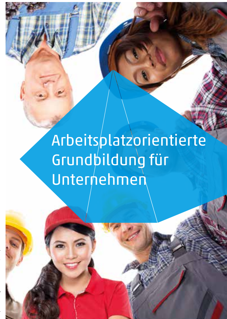
Konzept/Kreation: Agentur 3PUNKTDESIGN, Köln